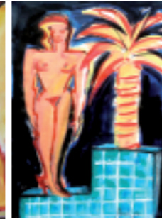
In the Heat of the Night Gouache sur papier Signée et datée Bach 84 29,5 x 41,5 cm