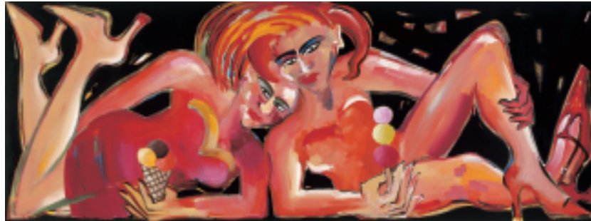
Tête à Tête Peinture à la résine synthétique sur toile de lin Signée et datée Bach 2004 120 x 350 cm