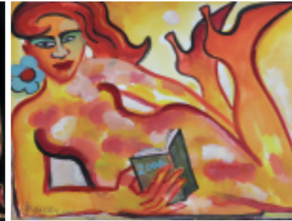
Plein Été Gouache sur papier Signée et datée Bach 2006 24,7 x 31,7 cm